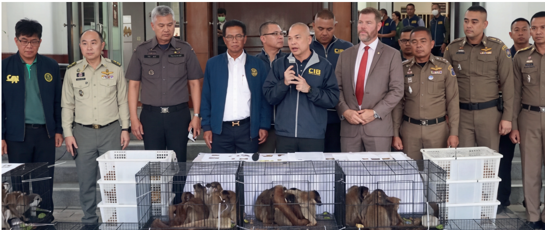
Quelques-uns des animaux saisis.