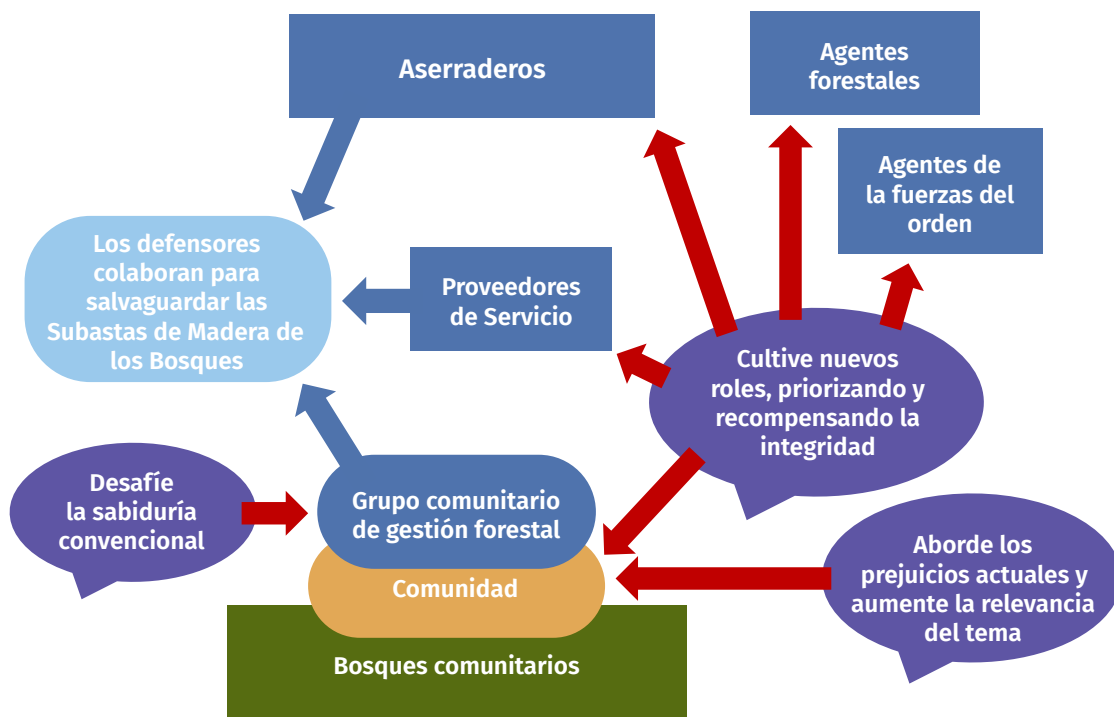
Gráfico 2. Aplicación de la óptica de las normas sociales y el cambio de comportamiento a la corrupción colusoria

Adoptar un enfoque holístico, trabajando para cambiar las creencias y los comportamientos de todos los grupos implicados, puede ser la base para seguir desarrollando la apropiación colectiva de prácticas de manejo forestal comunitario dignas de elogio y cultivar un sentimiento de orgullo a nivel comunitario. (Véase el Gráfico 2)