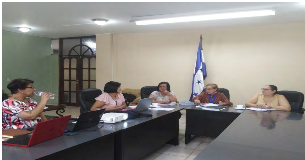
Reunión con la Junta directiva de del Colegio de Químicos Farmacéuticos de Honduras