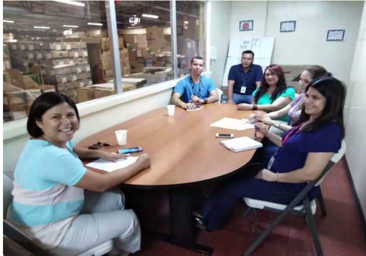
Reunión de trabajo con el equipo del Almacén Nacional de Medicamentos e insumos