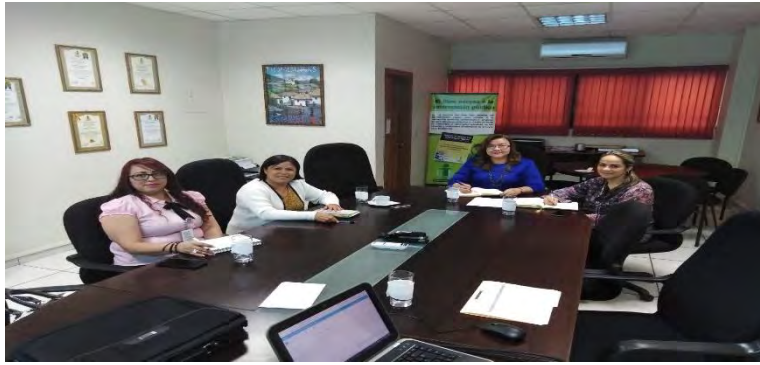
Reuniones de trabajo con el Instituto de Acceso a la Información Pública